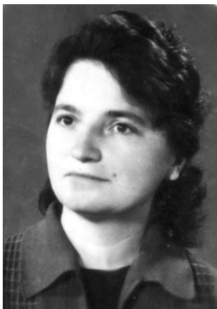
Із повагою, випускники 1963 року.

Літа цвіли не просто цвітом, А проростали у труді. Дорослими вже стали діти, А ви душею молоді. Хай буде світлим кожен день в житті. Хай негарзди завжди обминають. Хай буде легко Вам вперед іти, І словом добрим Вас завжди вітають У цей прекрасний ювілей.