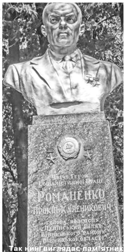
Так нині виглядає пам'ятник

Члени оргкомітету, згадані в газеті «Подільська зоря» від 28 липня 2016 року.