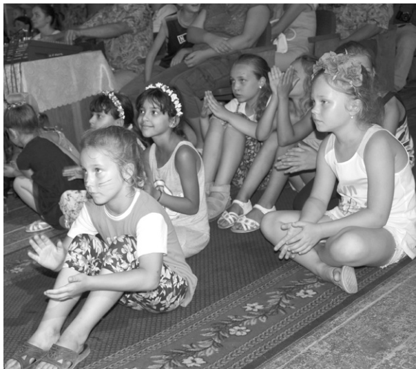
Юні глядачі концерту розташувались перед сценою