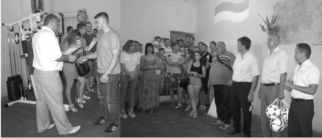
Урочисте відкриття тренажерної зали у приміщенні Будинку культури

вано новий храм преподобного Серафима Саровського.